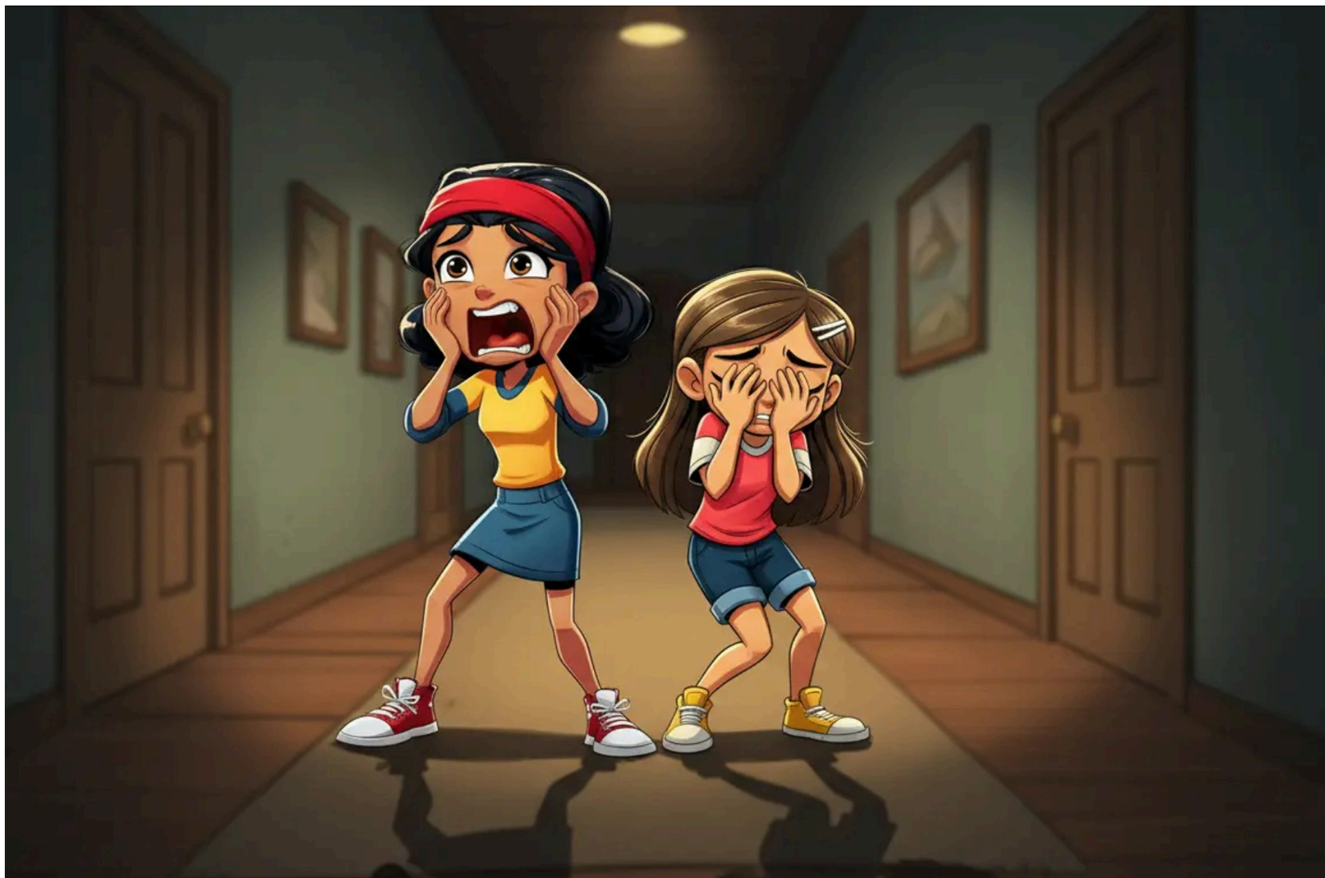
Natalia gritó y Cristina se tapó la cara